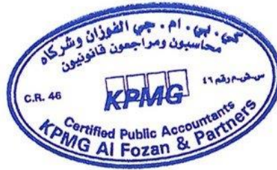
Nasser Ahmed Al Shutairy License No. 454

Jeddah, 22 Jumada Al-Awwal 1442H Corresponding to 6 January 2021