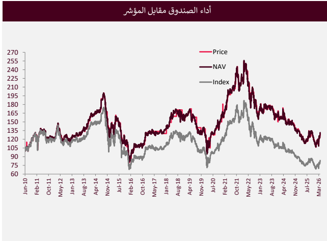
أداء الصندوق مقابل المؤشر