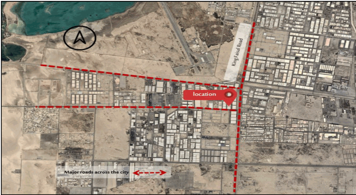
An aerial photo of the subject ( Neighbourhood )