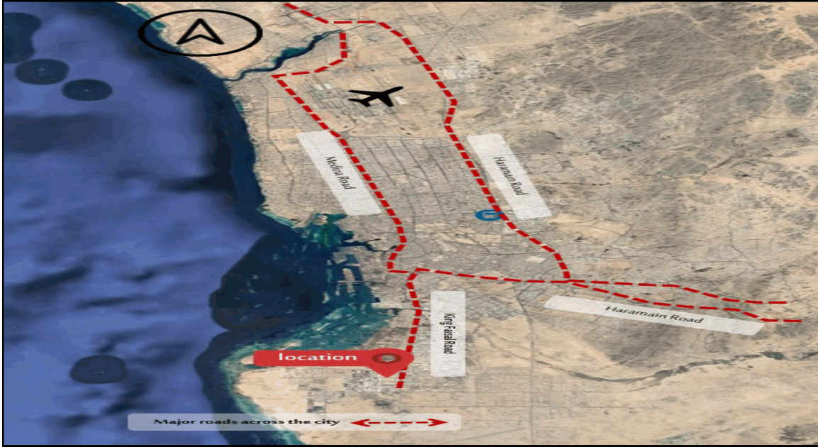
An aerial photo of the subject city )