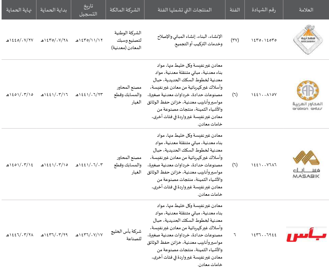
الجدول رقم (٦٤): العلامة التجارية

* انتقلت صلاحية تسجيل العلامات التجارية إلى الهيئة السعودية للملكية الفكرية