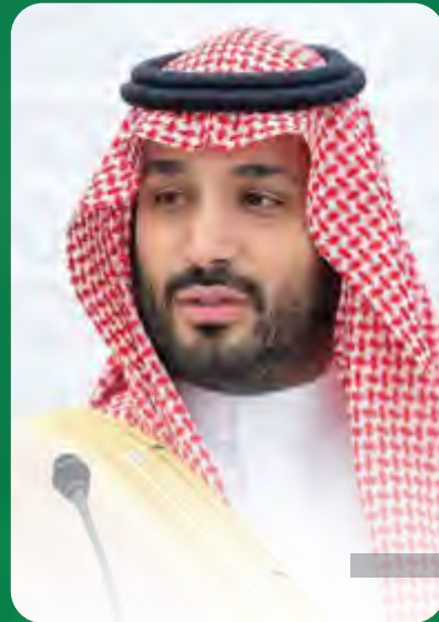
صاحب السمو الملكي الأمير محمد بن سلمان بن عبدالعزيز آل سعود ولي العهد ورئيس مجلس الوزراء