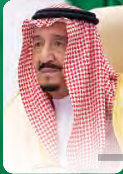
صاحب السمو الملكي الملك سلمان بن عبدالعزيز آل سعود يحفظه الله