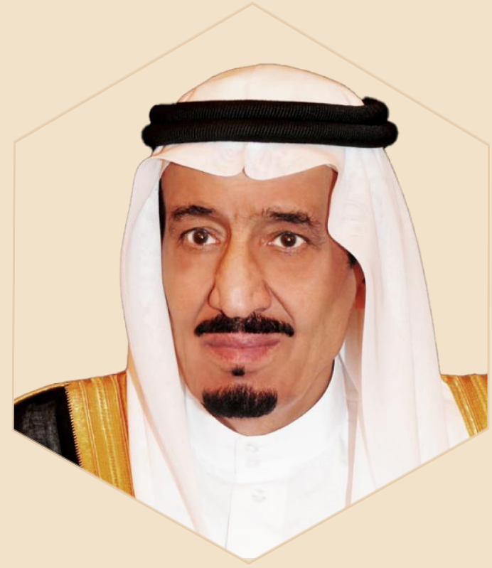
خادم الحرمين الشريفين الملك سلمان بن عبد العزيز آل سعود حفظه الله

” نحاول ألا نعمل إلا مع الحالمين الذين يريدون خلق شيء جديد في هذا العالم.“