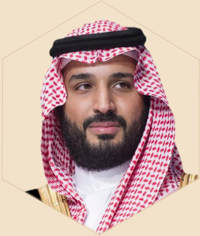
صاحب السمو الملكي الأمير محمد بن سلمان بن عبد العزيز آل سعود حفظه الله

” نحاول ألا نعمل إلا مع الحالمين الذين يريدون خلق شيء جديد في هذا العالم.“