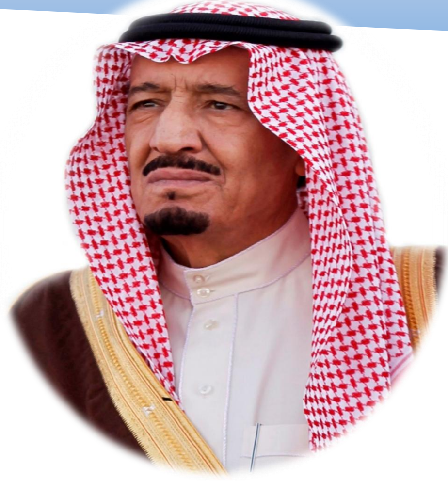
خادم الحرمين الشريفين الملك سلمان بن عبدالعزيز حفظه الله

تعد المملكة العربية السعودية أحد أهم وأكبر اقتصادات العالم ونسعى بجدية للعمل على مضاعفة حجم الاقتصاد.