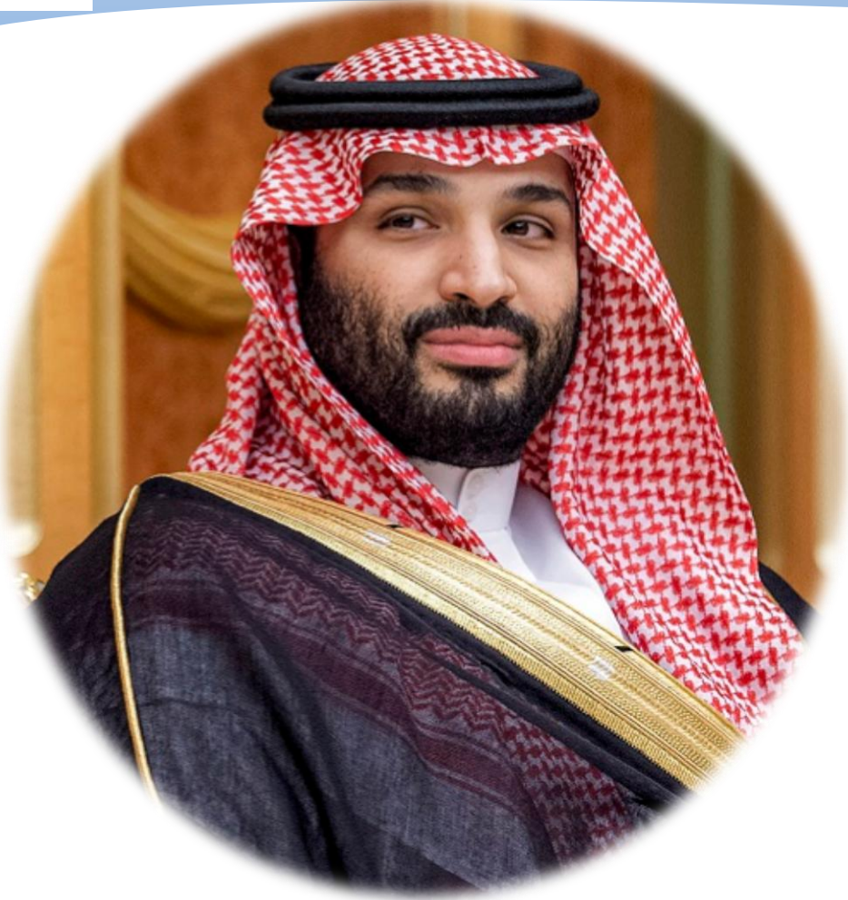
بسمو ولي العهد الأمير محمد بن سلمان حفظه الله

تعد المملكة العربية السعودية أحد أهم وأكبر اقتصادات العالم ونسعى بجدية للعمل على مضاعفة حجم الاقتصاد.