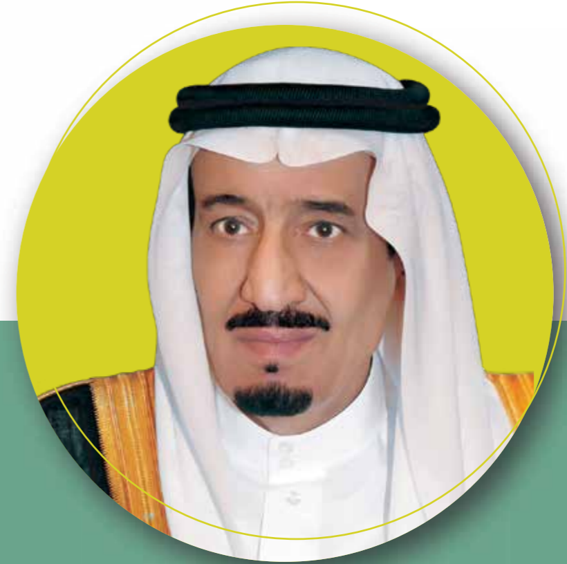
فادم الحرمين الشريفين