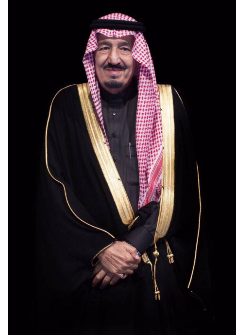
خادم الحرمين الشريفين الملك