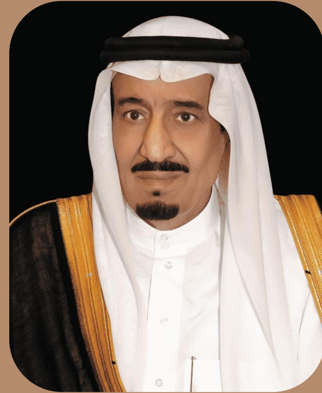
الملك سلمان بن عبدالعزيز آل سعود خادم الحرمين الشريفين