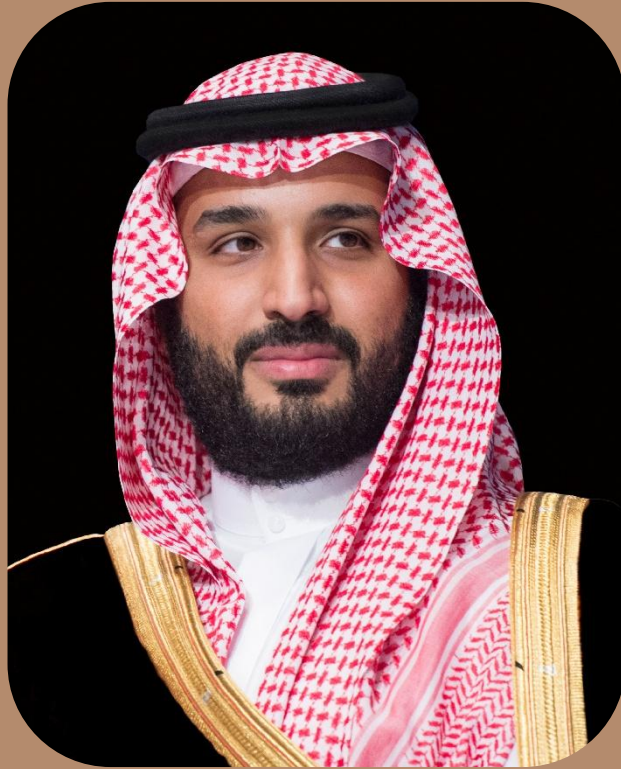
الأمير محمد بن سلمان بن عبدالعزيز آل سعود ولي العهد ورئيس مجلس الوزراء