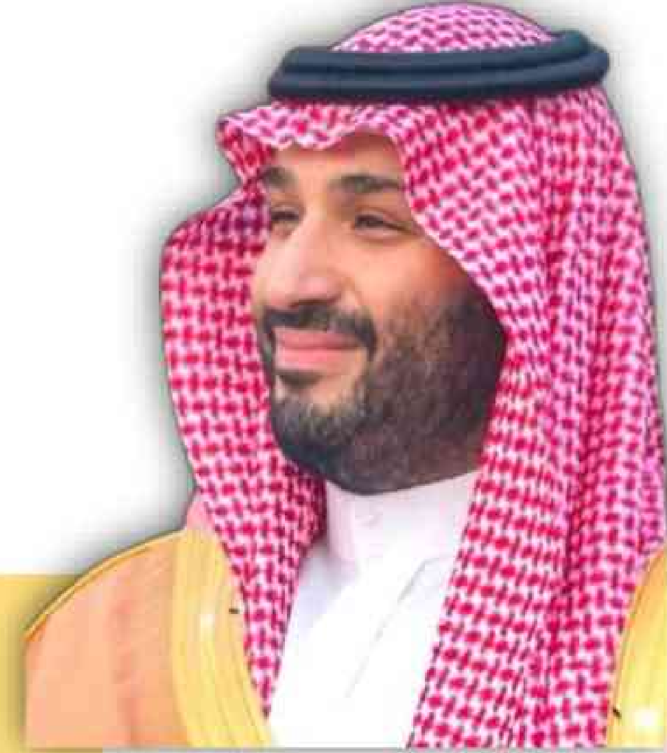
صاحب السمو الملكي الأمير محمد بن سلمان بن عبد العزيز آل سعود ولي العهد ورئيس مجلس الوزراء حفظه الله