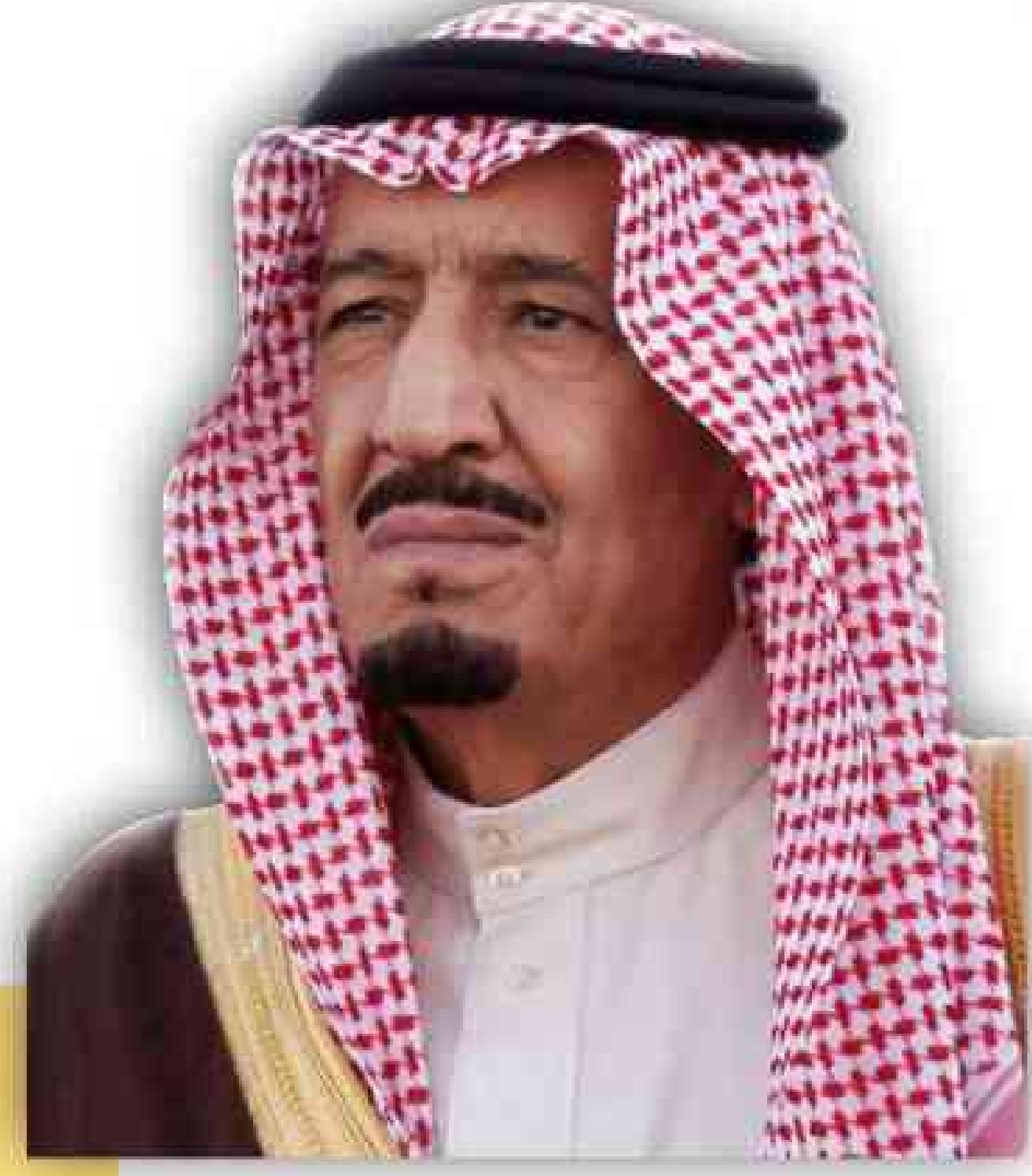
خادم الحرمين الشريفين الملك سلمان بن عبد العزيز آل سعود