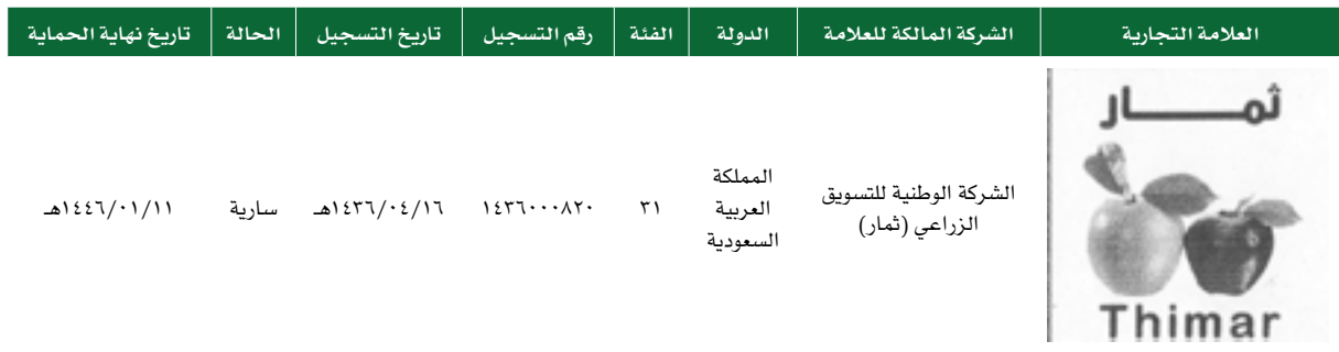
الجدول رقم (٧): العلامات التجارية

تعتمد الشركة في تسويق خدماتها على علامتها التجارية، والتي تدعم أعمالها ومركزها التنافسي، وتمنحها تميزاً واضحاً في السوق بين العملاء، قامت الشركة بتسجيل علامتها التجارية لدى وزارة التجارة والصناعة وفقاً للجدول أدناه: