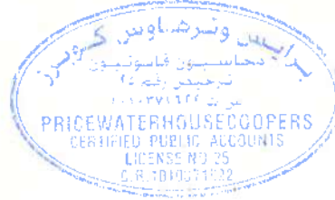
عمر محمد السقا ترخيص رقم 369